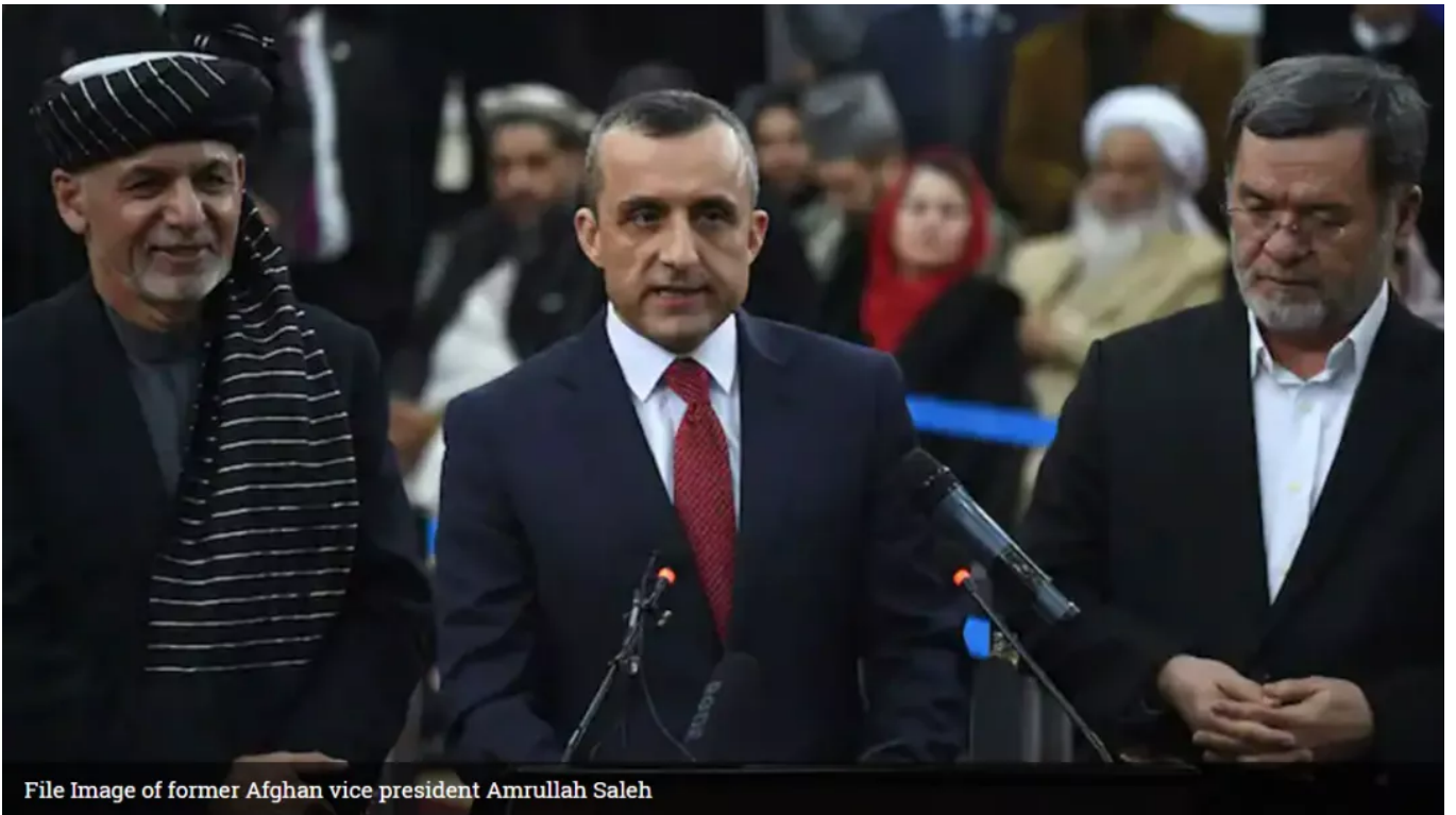
File Image of former Afghan vice president Amrullah Saleh

至于塔利班，既然已经宣布建国，多半也会选出总统或者类似的国家元首。于是我们可能会看到阿富汗出现一国三元首，三方乱入的情况，其情景会极其壮观。