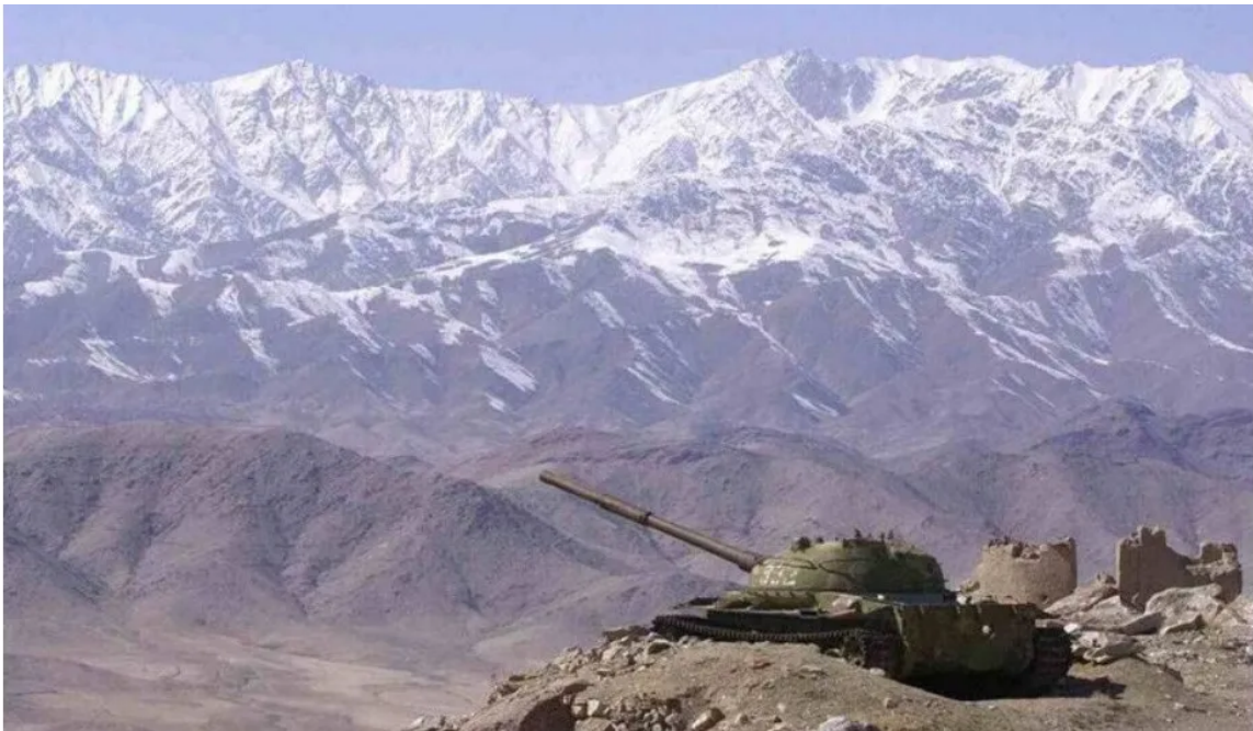
占阿富汗70%领土的兴都库什山脉镇楼

最近阿富汗形势一日千里，七万塔利班在米帝撤军之际发动反击，而三十多万阿富汗政府军迅速土崩瓦解。塔利班在旬日之内就连下数城，最后一鼓作气攻下了阿富汗首都喀布尔并建国：