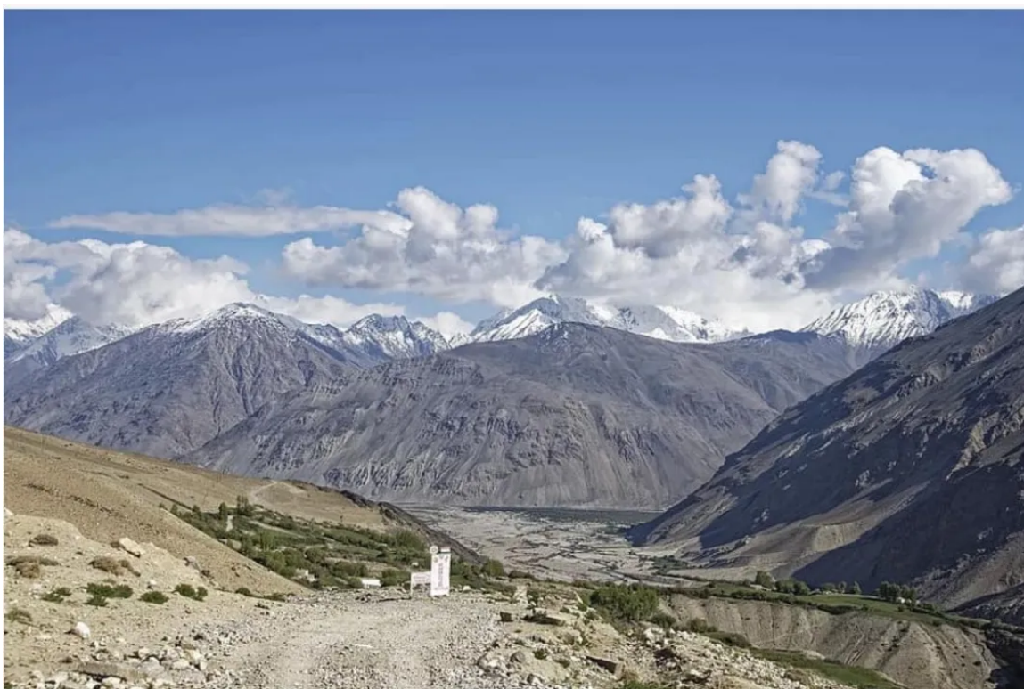
tajikistan, province of mountain-badakhshan, pamir, hindu kush, high mountains, the pamir valley, landscape, mountains, snow, clouds, sky