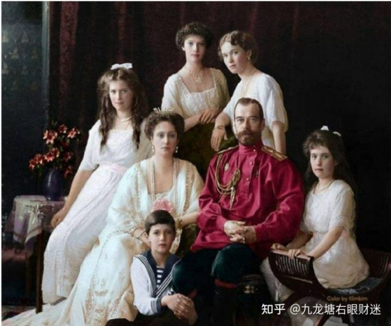
上图：铲家铲的沙皇尼古拉二世全家

1914年-1918年的第一次世界大战导致了俄国革命，结果是沙皇尼古拉二世全家被契卡杀光：